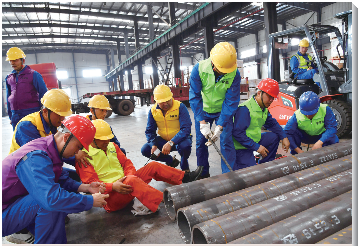
6月14日,新北区市场监管局与常州永安洲长江码头有限公司在码头仓库内组织开展了特种设备(起重机械)事故应急演练活动。新北区20多家特种设备使用单位的相关负责人到场观摩。

本次试点工作引入了资产云系统,相关单位将在“资产绩效—绩效测评”模块中开展自评,便于统一操作与主管部门审核。据悉,资产绩效评价评价的结果将应用于服务单位国有资产标准化管理、与部门年度预算挂钩、提升财政部门资产管理服务水平以及供人大监督使用等四个方面,可帮助各单位对资产管理进行查漏补缺,并作为单位资产配置的重要依据。