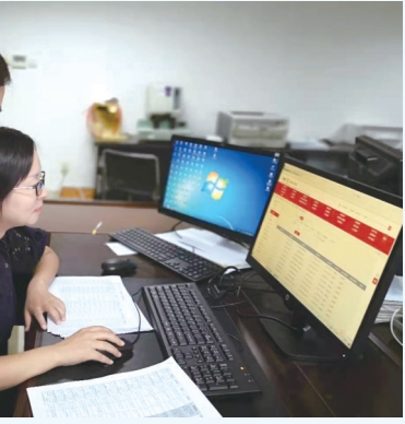
基层财政工作人员在办理国库集中支付业务。